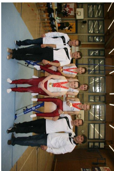
Gruppenfoto anlässlich der erfolgreichen SMJ 2013 in Schaffhausen

Um weiterhin konkurrenzfähig bleiben zu können, sieht sich die KVKSÖ veranlasst, im Jahr 2014 einen neuen Bodenbelag zu beschaffen, Kostenpunkt ca. Fr. 40'000.00